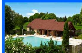
Piscine extérieure chauffée