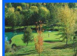
Golf 18 trous Compact 6 trous Practice

39570 VERNANTOIS - LONS LE SAUNIER / Tel : 03 84 43 04 80 - Fax : 03 84 47 31 21