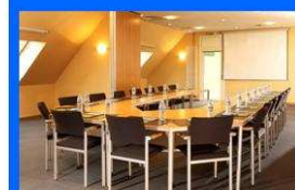
6 salles de réunions