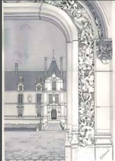
Croquis du château depuis le porche via dessin Christine Lemarié